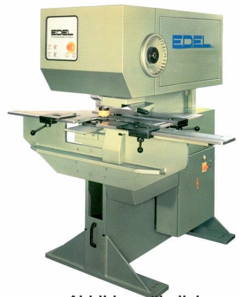
Abbildung ähnliche Maschine